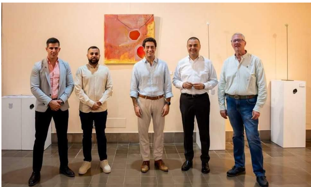
Inauguración de la exposición

REDACCIÓN SÁBADO, 08 DE JUNIO DE 2024Tiempo de lectura: 2 min